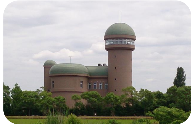
手賀沼親水広場水の館