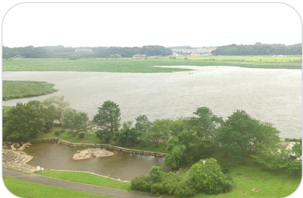
手賀沼ハスの群生地方面