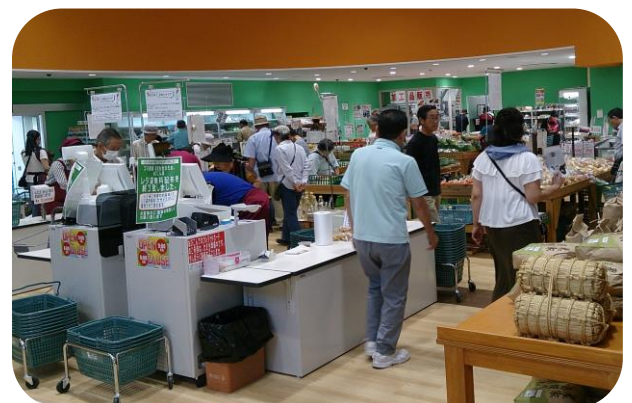
水の館農産物直売場